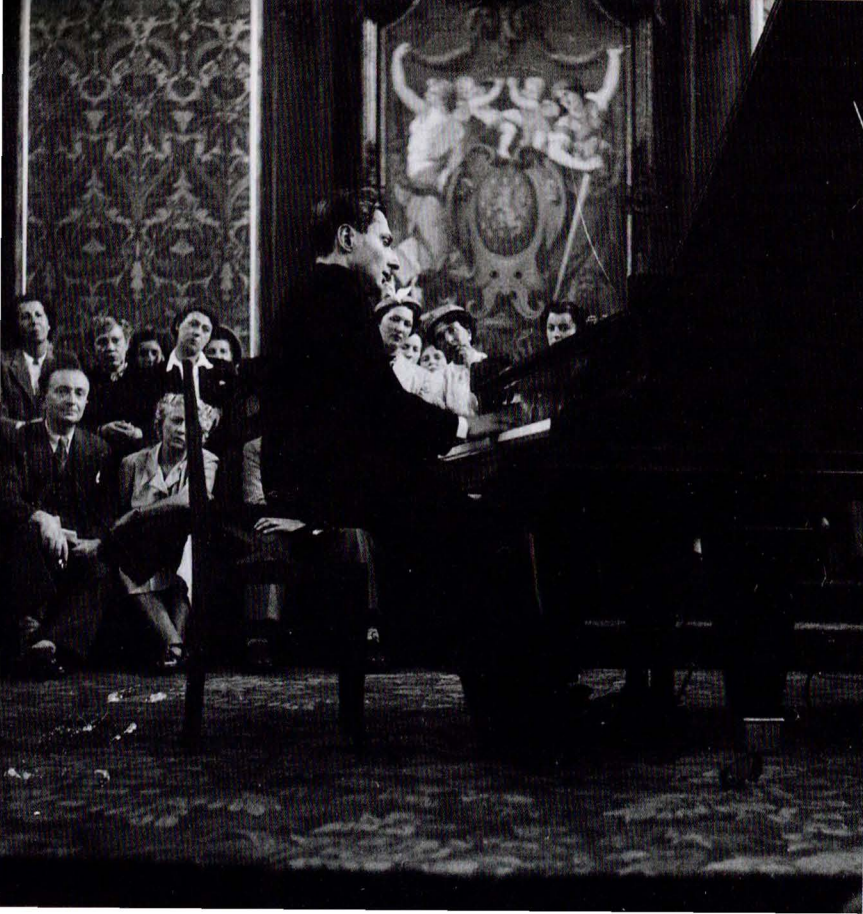
Le récital