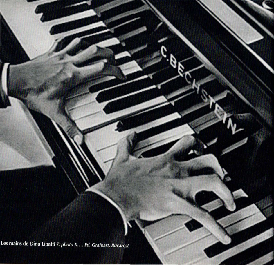
Les mains de Dinu Lipatti