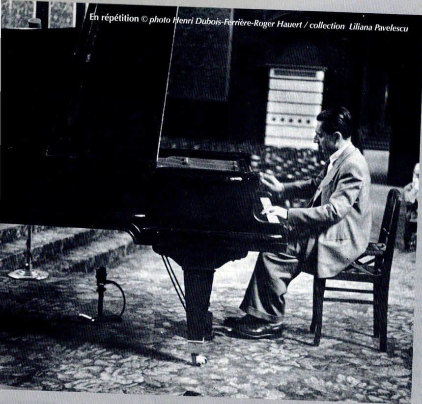
En répétition