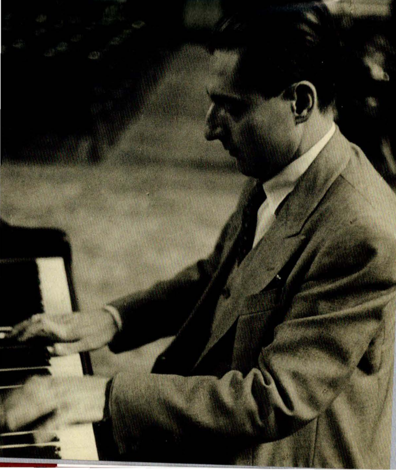
En répétition