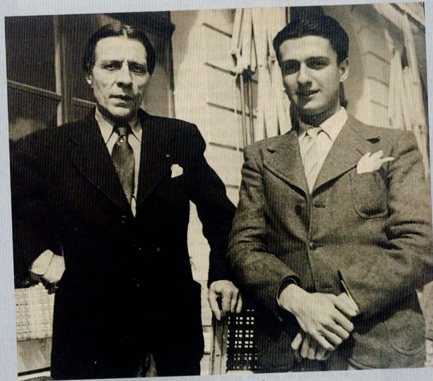
Alfred Cortot et Dinu Lipatti