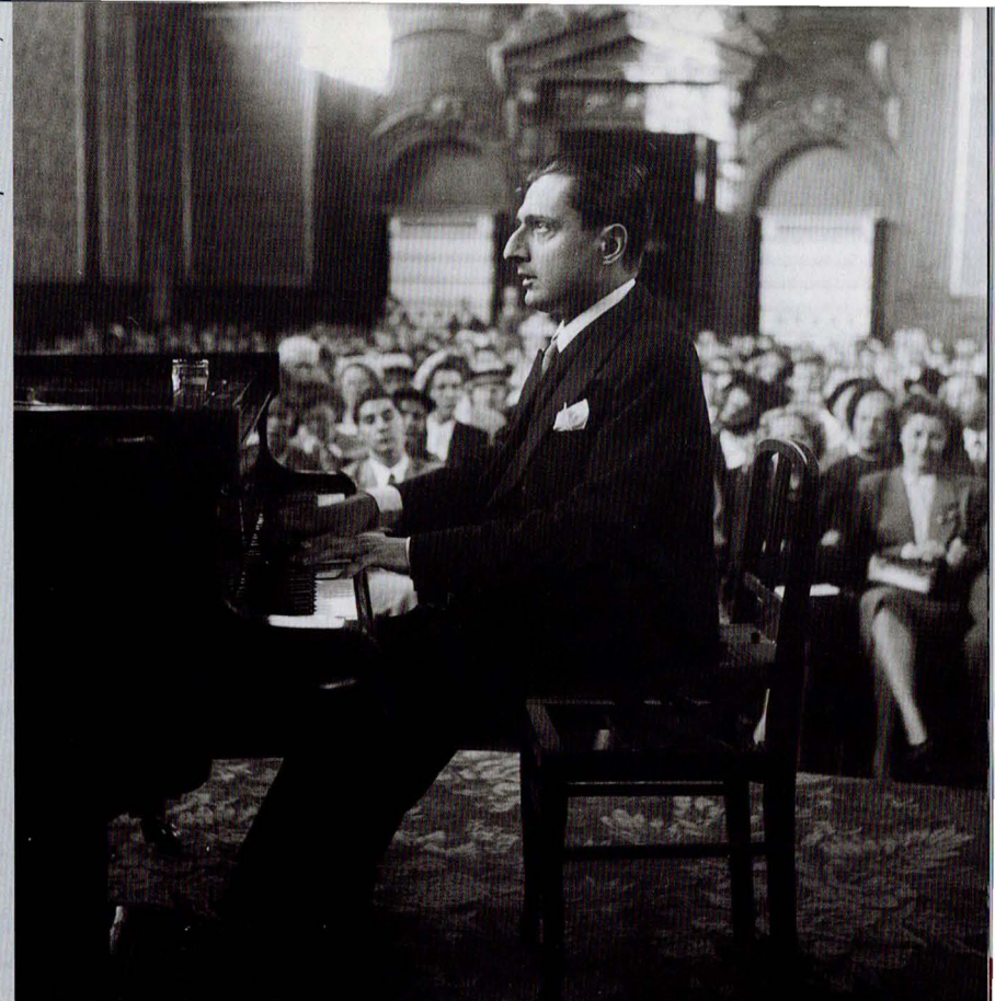
Le récital