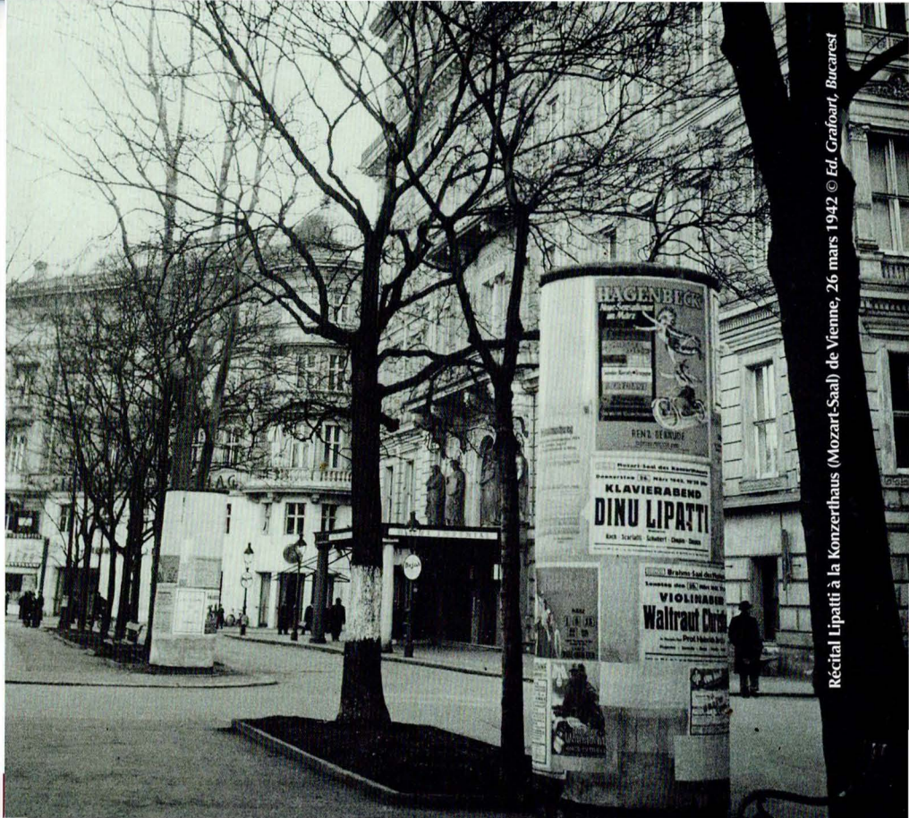
Récital Lipatti à la Konzerthaus (Mozart-Saal) de Vienne, 26 mars 1942