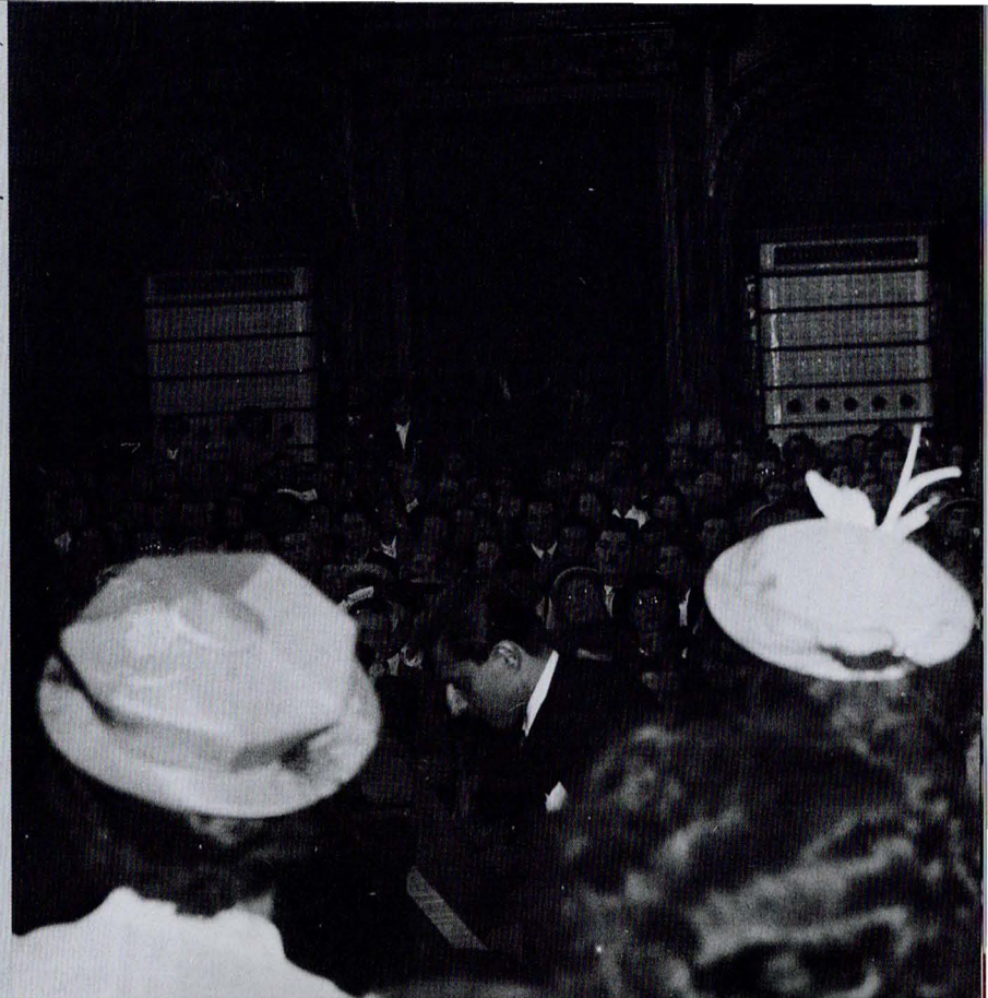
Le récital