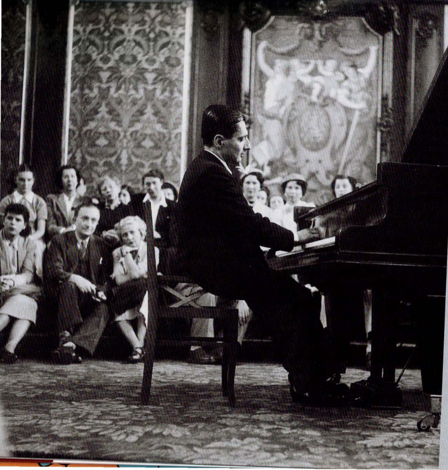
Le récital