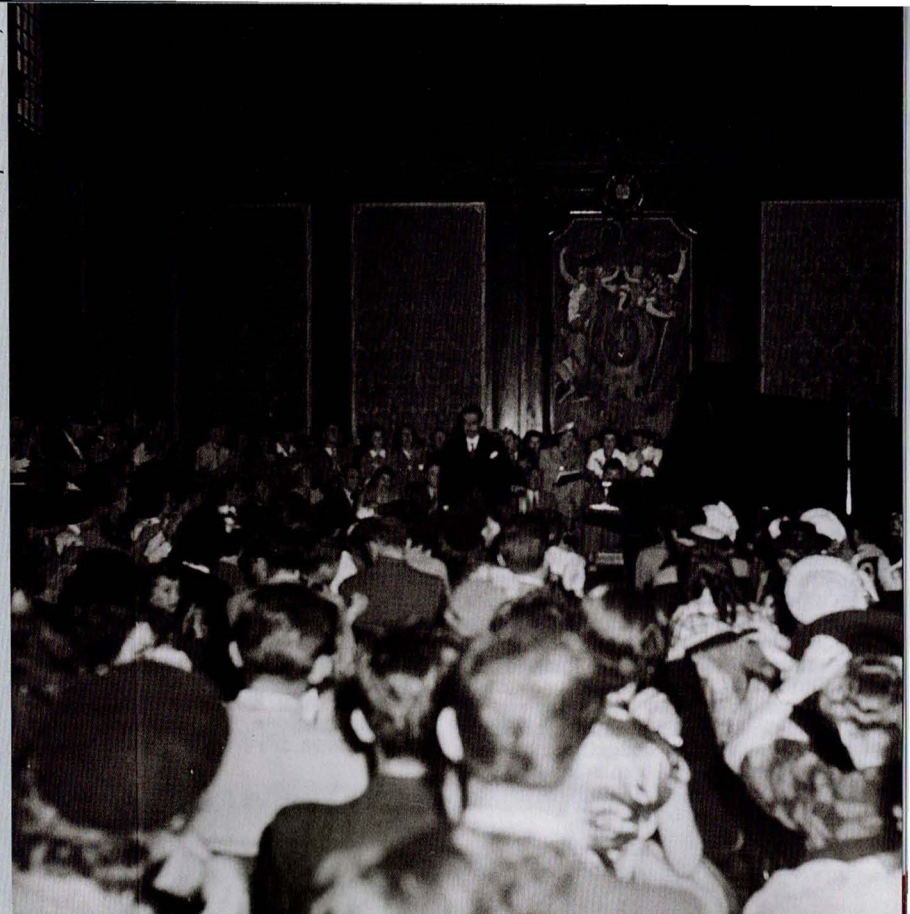
Le récital